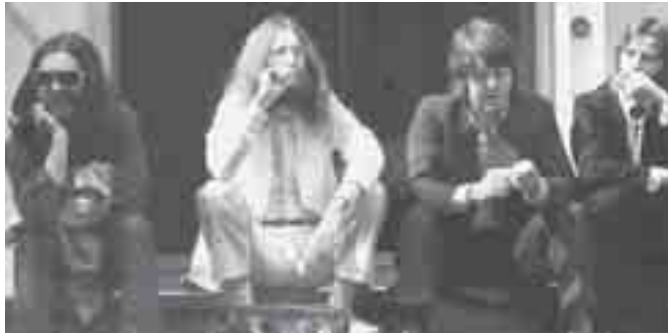
Más abj: Contraportada.