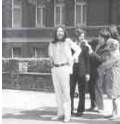
Izq: Paul McCartney cruza descalzo Abby Road.